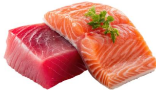
● เนื้อปลาดิบ