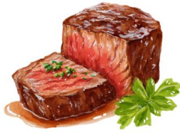
● เนื้อวัว

ขอความกรุณาแจ้งวัตถุดิบที่ท่านแพ้หรือไม่สามารถรับประทานได้