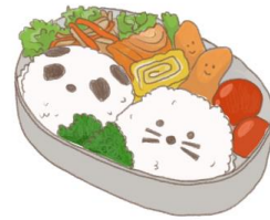
● อาหารสำหรับเด็ก ( 2-11 ปี ) *วัตถุดิบขึ้นอยู่กับทาว์ราน