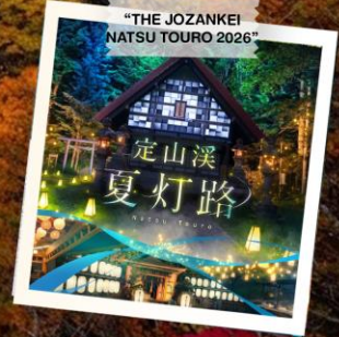
"THE JOZANKEI NATSU TOURO 2026"

วันเดินทาง 23 - 28 ต.ค. 2569 (วันปืยมหาราช) 28 ต.ค. - 2 พ.ย. 2569 30 ต.ค. - 4 พ.ย. 2569