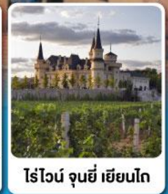
ไร่ไวน์ จุนยี่ เยียนไถ