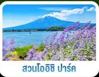
สวนโอะอิชิ ปาร์ค