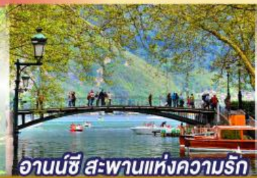
อานน์ซี สะพานแห่งความรัก