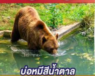
บ่อหมีสีน้ำตาล