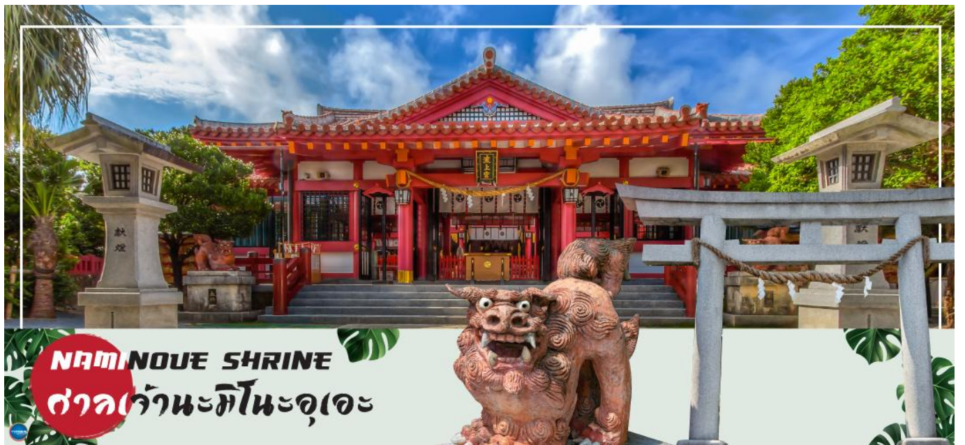
NAMINOUE SHRINE ศาลเจ้านะมิโนะอุเอะ

วันที่สี่ ศาลเจ้านามิโนะอุเอะ – ห้างสรรพสินค้า พาร์ค ซิตี้ – ทำอากาศยานนาสะ โอกินาวา – ทำอากาศยานดอนเมือง กรุงเทพฯ