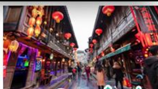
ถนนโบราณจินหลี่