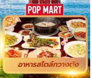
อาหารสตรีทกวางตุ้ง