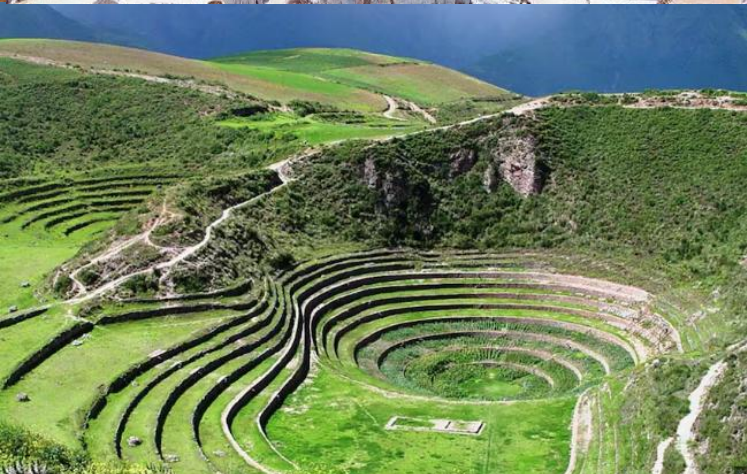
บ่าย นำท่านเดินทางสู่ มาราซ (Maras) แหล่งผลิตเกลือที่คุณภาพดีที่สุดในโลก ที่มีมาตั้งแต่สมัยอินคา แนวนาชั้นบันไดที่เรียงอยู่ตามลำดับความสูงของภูเขา จากนั้นเดินทางสู่ โมเรย์ (Moray) นาชั้นบนโดวงกลมขนาดใหญ่หลายๆรูปร่างแปลกตาที่ชาวอินคาทำไว้เพื่อทดลองปลูกพืชพันธุ์ต่างๆ จากจุดนี้สามารถมองเห็น หมู่บ้านอูรัมบัмба (Urubamba) ได้อีกด้วย ได้เวลาเดินทางกลับสู่เมือง เมืองคัสโก (Cusco) เมืองหลวงของอาณาจักรอินคา ที่แพร่ขยายอำนาจจนกินพื้นที่ 1 ใน 3 ของอเมริกาใต้ ตั้งอยู่เหนือระดับน้ำทะเลถึง 3,400 เมตร และเป็นแหล่งอารยธรรมยุคก่อนประวัติศาสตร์ที่ลึกลับน่าทึ่ง เป็นชุมชนเก่าแก่ของจักรวรรดิอินคาอันรุ่งเรือง ซึ่งยังคงทิ้งร่องรอยความเจริญไว้ให้เห็นเป็นซากปรักหักพังโบราณและโบราณวัตถุต่างๆ