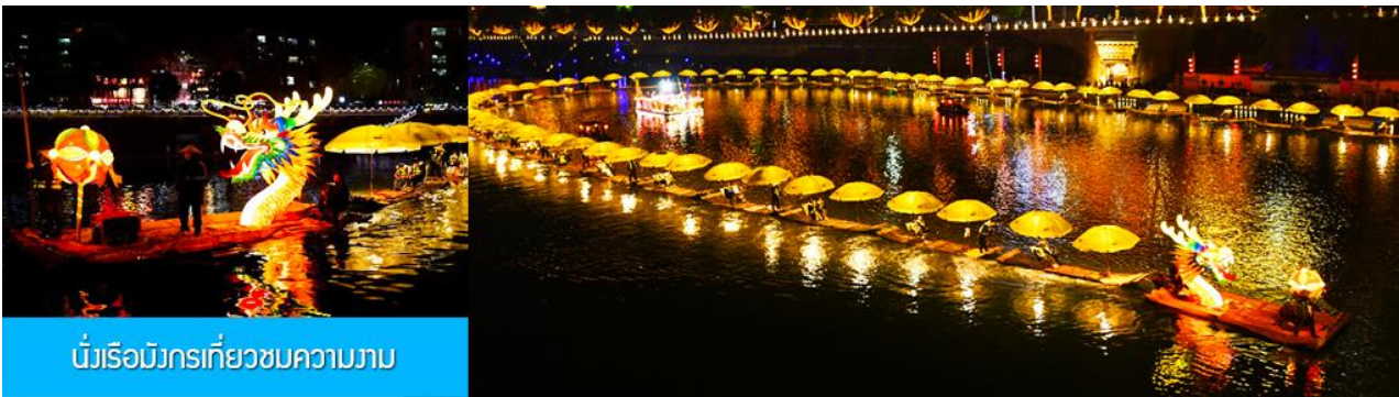
นั่งเรือมังกรเที่ยวชมความงาม

หลังอาหารนำท่านเดินทางเข้าที่พัก ไค้ด้นำเสนอโปรแกรมเสริม เป็น โปรแกรม นั่งเรือมังกร เที่ยวชมความงามของบ้านเรือนและสิ่งปลูกสร้างสองฝั่งแม่น้ำในช่วงที่สวยงามที่สุดของเมือง เจียนเอิน ที่ประดับประดาด้วยแสงสี และได้ชื่อว่าเป็นวิวยามค่ำคืนที่สวยงามที่สุดในมณฑลหูเป่ย์ เช่นเดียวกับเมือง โบราณฟงหวง ในมณฑลหูหนาน..... อัตราค่าบริการสำหรับโปรแกรมเสริมนั่งเรือมังกรชมวิวยามค่ำคืน ท่านละ 190 หยวน หรือ 950 บาท ระยะเวลาที่ใช้ในการเรือมังกร ประมาณ 45 นาที ค่าบริการรวม ค่าบัตรเข้าชม ค่ารถรับ ส่ง และค่าน้ำที่ขงไค้ต้อถิ่ง