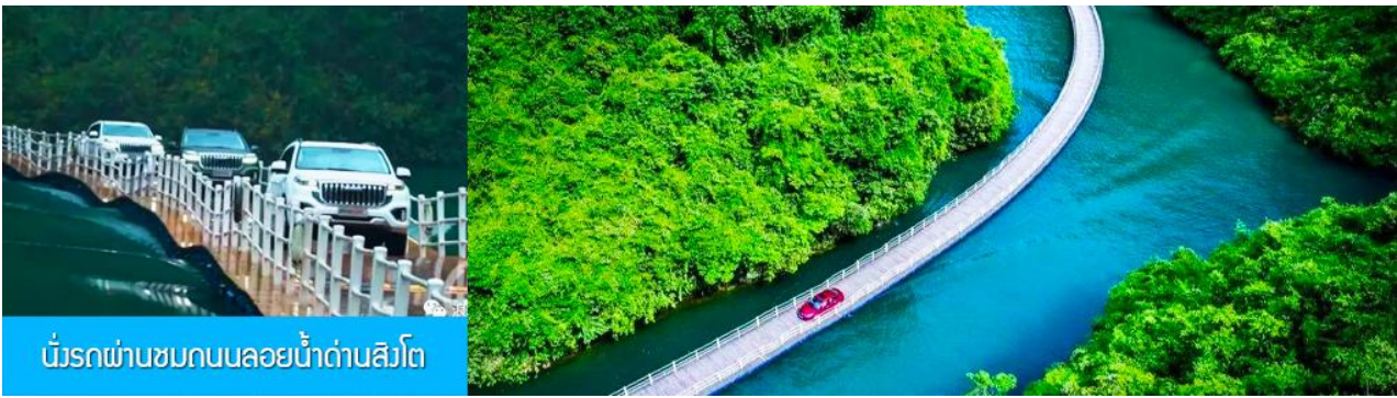
นั่งรถผ่านชมถนนลอยน้ำด่านสิงโต

หลังอาหารนำท่านเดินทางโดยรถบัสสู่เมือง เจียนเอิน 宣恩市 (ระยะทาง 112 กม ใช้เวลาเดินทางราว 1 ชั่วโมงครึ่ง) ระหว่างทาง ไค้ต้อถิ่ง นำเสนอขายโปรแกรมเสริม ชุดนั่งรถผ่านชมถนนลอยน้ำด่านสิงโต 獅子关 อุทยานท่องเที่ยวที่กลายเป็นจุดเช็คอินยอดนิยมของเมืองเอินซือ เคยเป็นจุดตั้งด่านป้องกันการโจมตีของข้าศึก และเป็นด่านเก็บภาษีสินค้าในอดีต ด้วยลักษณะภูมิประเทศที่เป็นทางสัญจรในช่องแคบที่มีผาหินสูงชันมีรูปร่างคล้ายสิงโตเป็นปราการ เหมาะแก่การตั้งด่านสกัด จึงได้รับการขนานนามเป็นด่านสิงโตที่เป็นหนึ่งในสามด่านสำคัญของมณฑลหูเป่ย์ในอดีต.....ไฮไลท์ของการเที่ยวอุทยานคือการ นั่งรถเล่นผ่านสะพานลอยน้ำความยาว 9 กม. เป็นสะพานที่ใช้ทุ่นลอยน้ำที่ร้อยเรียงเป็นแนวยาวเหนือน้ำ ได้สะพานไม่มีตอม่อก้ำกั้น ระหว่างที่รถวิ่งผ่านสะพานท่านจะได้สัมผัสวิวทิวทัศน์ที่สวยงามสองฝั่งสะพานและน้ำสีเขียวมรกต..... อัตราค่าบริการสำหรับโปรแกรมท่องเที่ยวอุทยาน ด่านสิงโต ท่านละ 300 หยวนหรือ 1,500 บาท รวมค่าบริการเข้าอุทยาน ค่ารถอุทยานผ่านชมถนนลอยน้ำ ค่ารถรับ ส่ง ไปยังอุทยาน รวมเวลาที่ท่องเที่ยวและเดินทางไป กลับ ราว 2 ชั่วโมงเศษ