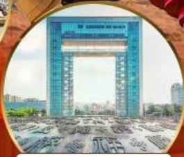
ประตูแห่งความสุข