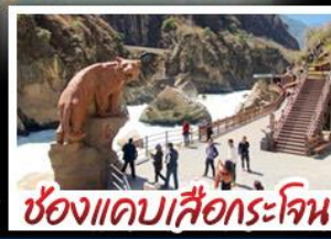
ช่องแคบเสือกะโจน