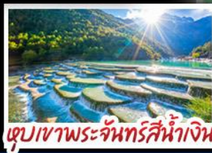
ตูปเขาพระจันทร์สีน้ำเงิน