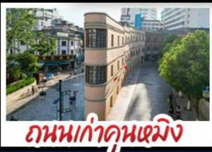
ถนนเก่าคุณหมิง