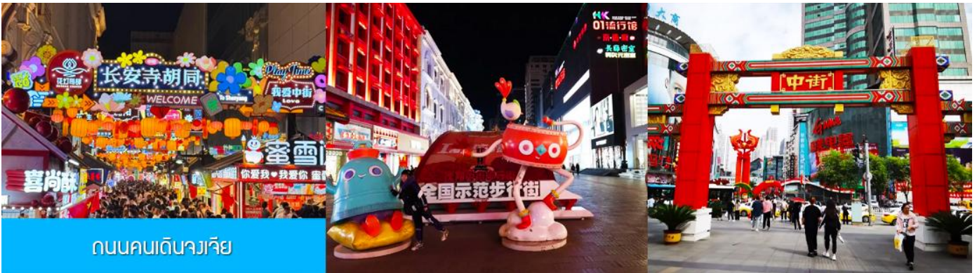
ถนนคนเดินจางเจีย

จากนั้นนำท่านเดินทางสู่ เมืองเสิ่นหยาง 沈阳市