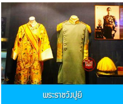
พระราชวังปู้ยี้

เช้า รับประทานอาหารเช้า ณ ห้องอาหารของโรงแรม (7)