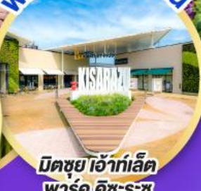
มิตซูเอะอิเกะอิเล็ค พาร์ค คิซะระซุ