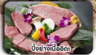
บิงย่างเนื้ออิดะ