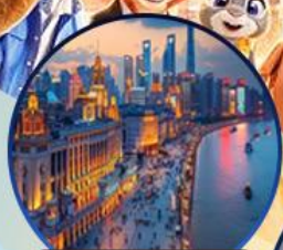
หาดไวทาน