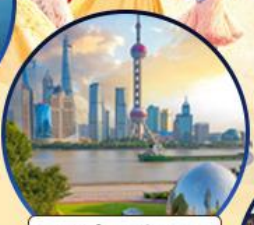
นอร์ทบิ้น กรีนแลนด์