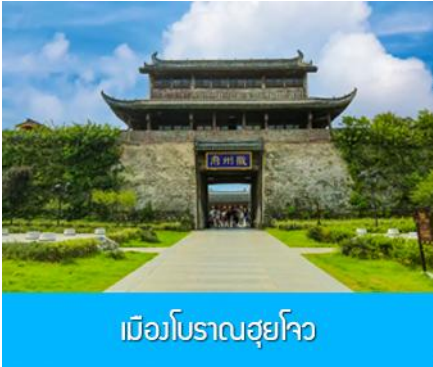
เมืองโบราณฮุยโจว