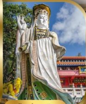
เจ้าแม่กวนอิม ริพลัสเบย์