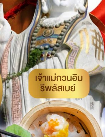
เจ้าแม่กวนอิม ริพลัสเบย์