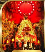
เจ้าแม่กวนอิม ฮ่องฮ่า