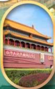
จัสมุตรีสเทียนอันเหมิน