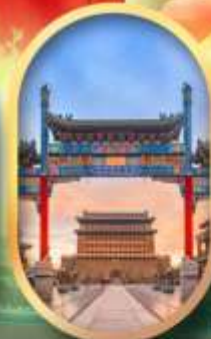
ถนนคนเดินเทียนเหมิน