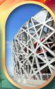
ผ่านชมสนามกีฬาาริงนก