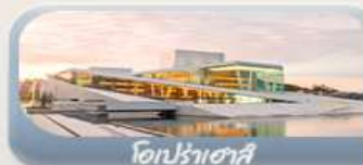
โอปราเฮาส์

สักครั้งในชีวิตกับการนั่งรถไฟสายโรแมนติกฟลิคสบนาน่า สองเรือชมฟยอร์ด ขึ้นกระเช้าลอยฟ้าพิชิตยอดเขาอูสริเคน เบอร์เกน นั่งรถรางสวยอดเขาฟลอมอนชมวิวเมือง ออสโล เยี่ยมชมโอปราเฮาส์ มหาวิหารออสโล ป้อมปราการอาครส์ฮูส สวนอนุสรณ์ชาติ Vigeland Sculpture Park