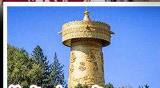
วัดต้าฝอ กงล้อมณฑล