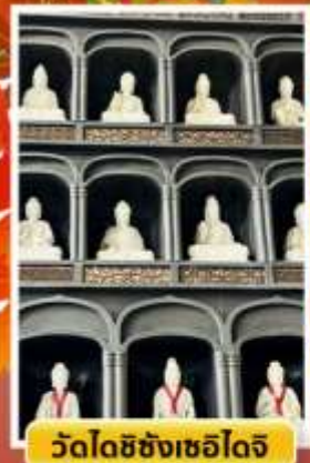
วัดไดชิซังเซโด้จิ