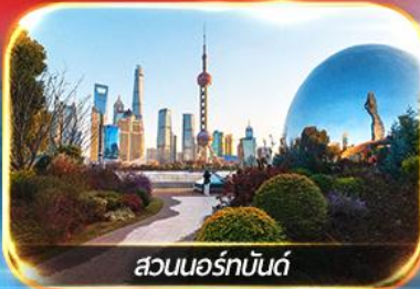
สวนนอร์มัลด์