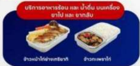
บริการอาหารร้อน และ น้ำดื่ม บนเครื่อง ขาไป และ ขากลับ