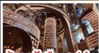
ภัตตาคารจิ้งจูก่อ