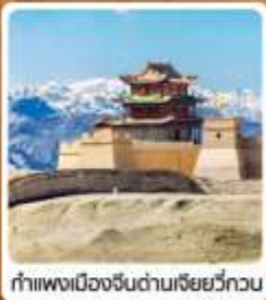
กำแพงเมืองจีนด่านเจี๋ยวิ๋กวน