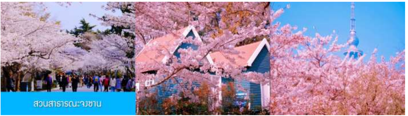
สวนสาธารณะนางซาบ

ถึงชิงเต่า นำท่านชมสวนสาธารณะจงซาน สวนจงซานได้ขึ้นชื่อว่าเป็นสวนที่ชมซากุระสวยที่สุดในเมืองชิงเต่า พอถึงช่วงดอกบาน ต้นซากุระสองข้างทางจะผลิบานพร้อมกัน กลายเป็นอุโมงค์สีชมพูขาว เดินเข้าไปในสวน แล้วบรรยากาศคือหวานละมุน และดูโรแมนติก จะบานช่วงปลายมีนา ถึง ต้นพฤษภาคม