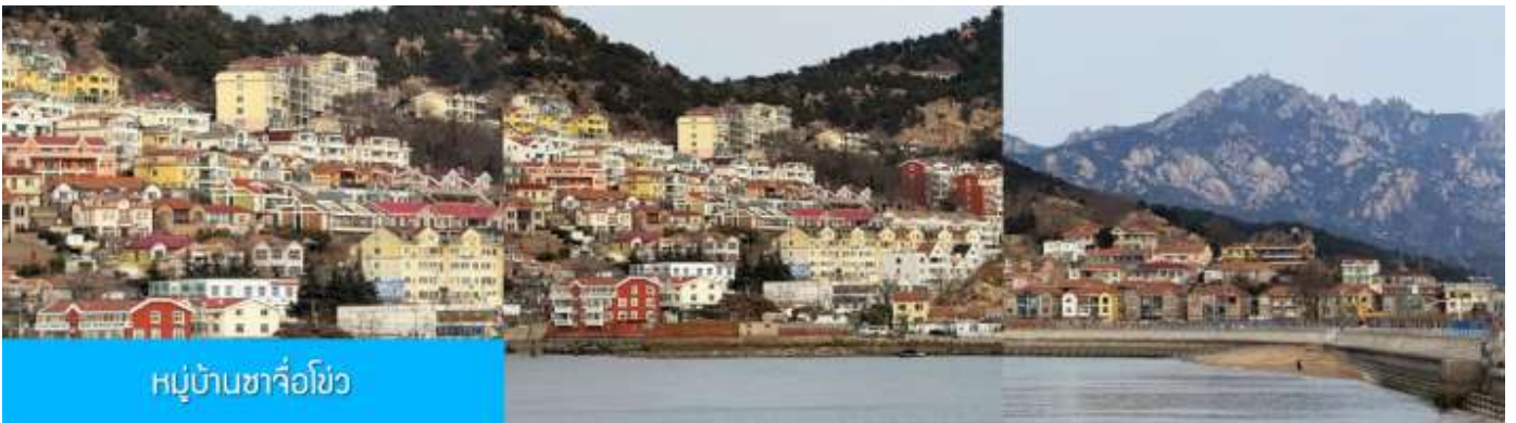
หมู่บ้านซาจื่อโขว

เที่ยง รับประทานอาหารกลางวัน ณ ภัตตาคาร (มื้อที่ 7)