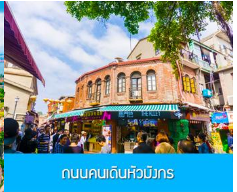
ถนนคนเดินหัวมังกร