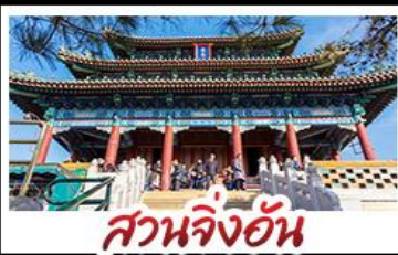
สวนจิ้งอัน