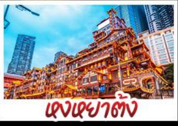
แสงเขย่าตึก