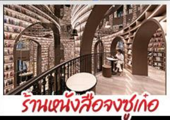
ร้านหนังสือจขูเก้อ