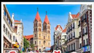
โบสถ์เซนต์ไมเคิล