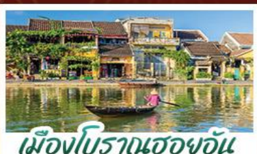
เมืองโบราณเฮอฮอัน

! พักบนเขานาฮิลล์ 1 คืน ! สัมผัสอากาศเย็นตลอดปี สตรีตฟรังเศสสุดคลาสสิก - นั่งกระเช้ายาวที่สุด สู่มานาฮิลล์ สนุกสุดมันส์ไปกับสวนสนุก The Fantasy Park นมัสการเจ้าแม่กวนอิมองค์ใหญ่ที่สุดของเมืองดานัง - เช็กอินเมืองมรดกโลกฮอยอัน - สนุกสนานไปกับกิจกรรม!!นั่งเรือกระดิง หมู่บ้านกัมทาน เช็กอินร้านกาแฟ SON TRA MARINA CAFE - ไม่หลงร้านช้อปปิ้ง - อิ่มอร่อยกับบุฟเฟ่ต์นานาชาติ , หม้อไฟซีฟู้ด