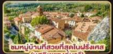
ชมหมู่บ้านที่สวยงามที่สุดในฝรั่งเศส (มูสดีเยแซงมาร์)