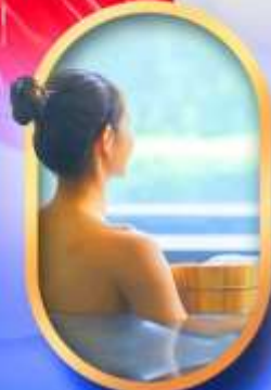
พักโรงแรมออนเซ็น