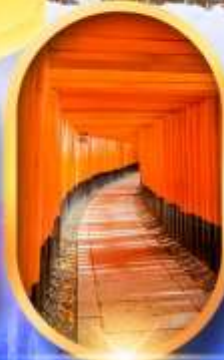
เมืองเก่าทาคายาม่า