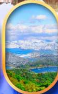
ทะเลสาบมิกะตะ