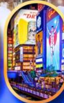
ย่านชิบะฮาชิจิ