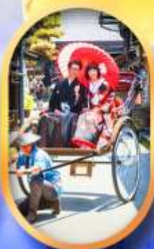
ศาลเจ้าจิ้งจอก