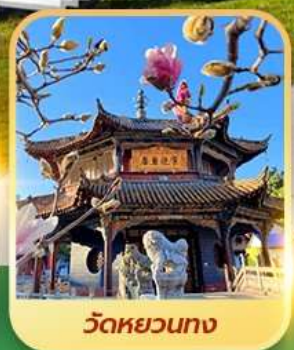
วัดหยวนทอง