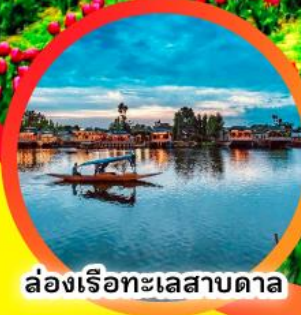
ล่องเรือทะเลสาบตาเล