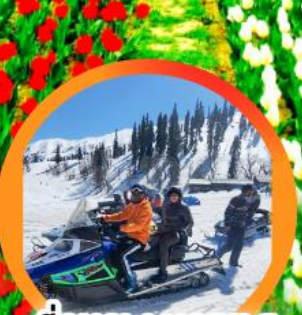
ขี่ SNOW MOBILE