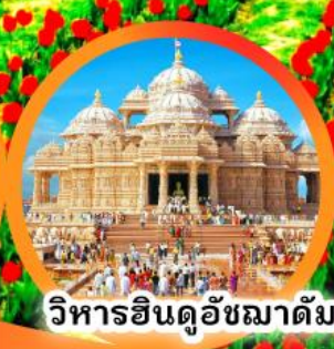
วิหารฮินดูอัชมาตี