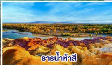
ธารน้ำห้าสี