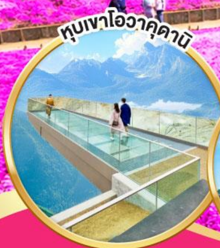
หุบเขาโอวาคุดานิ