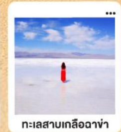
ทะเลสาบเกลือฉาซ่า