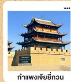
กำแพงเจียยี่กวน