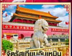
จัตุรัสเทียนจินเหมิน