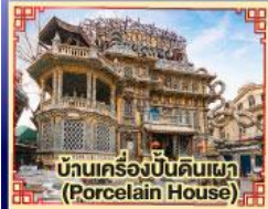
บ้านเครื่องปั้นดินเผา (Porcelain House)