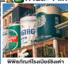
ชิมเบียร์ ท่าละ: 1 แก้ว