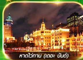
หาดไข่มุก (เดอะ บีนด์)

เที่ยวมหานครเซี่ยงไฮ้ ถ่ายรูปเช็กอินที่ Tian An 1000 Trees, ซินเทียนตี้ ช้อปปิ้งตลาดเงินหวงเหมียว, ถนนนานกิง