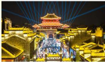
เมืองโบราณเซียงหยาง