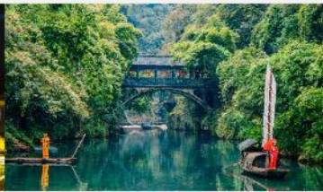
หมู่บ้านชานเสีเหรินเจีย