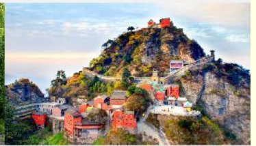
อุทยานเขาบู๊ต้ง

*ทางบริษัทฯ ขอสงวนสิทธิ์ในการสลับโปรแกรมทัวร์ตามความเหมาะสมขึ้นอยู่กับสถานการณ์หน้างาน โดยคำนึงถึงผลประโยชน์ของลูกค้าเป็นสำคัญ