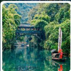
หมู่บ้านชาเมี่ยหมื่นเจีย