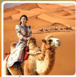
ขี่อูฐชมทะเลทราย