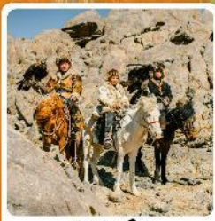
ชาวมองโกล