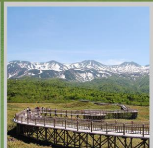
"SHIRETOKO 5 LAKES"