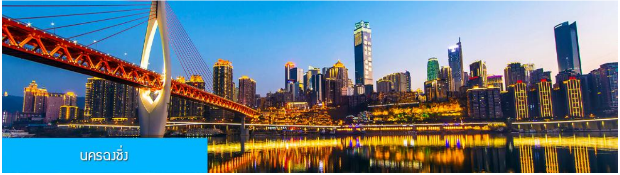
นครฉงชิ่ง