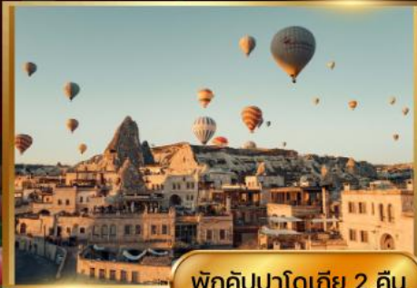
พักคัมปาโดเกีย 2 คืน