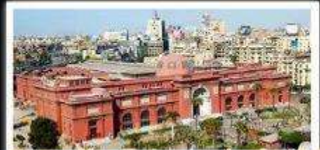
พิพิธภัณฑ์สถานแห่งอียิปต์