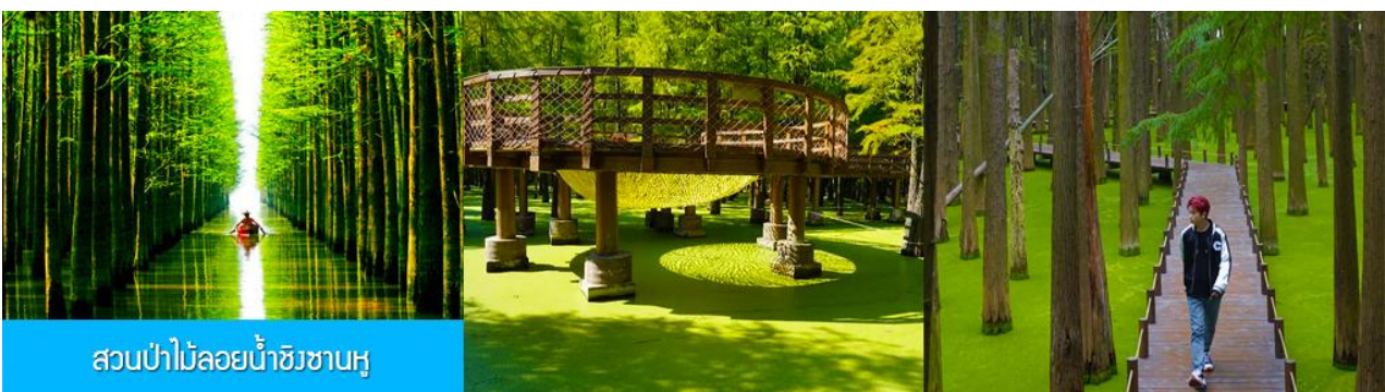
สวนป่าไผ่ลอยน้ำชิงซานหู

พักที่ PAIJING HOLIDAY HOTEL โรงแรมระดับ 4 ดาวท้องถิ่น หรือเทียบเท่า เมืองหวงซาน