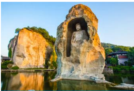
อุทยานเคอเหยียน

พักที่ โรงแรม KAIYUAN MINGTING HOTEL 4* หรือเทียบเท่าในเมืองเส้าชิง