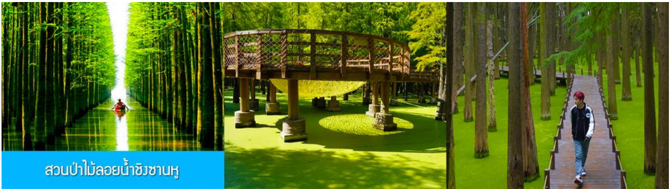
สวนป่าไผ่ลอยน้ำชิงชานหู