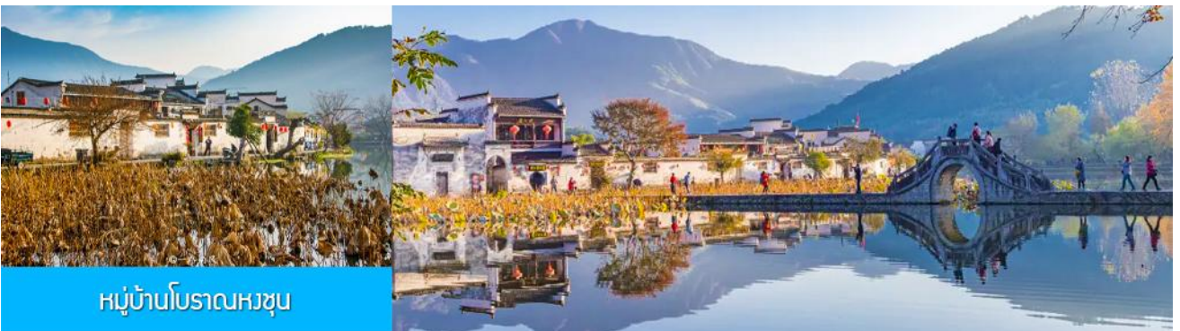
หมู่บ้านโบราณหงซุน

พักที่ โรงแรม QISHUHU HOTEL OR ZHONGCHENG SHANZHUANG 4* หรือเทียบเท่าในเขตอุทยานหวงซาน