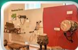
Museum of Folk Instrument