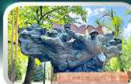
Panfilov Guardsmen Park