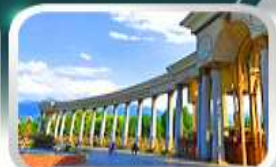
1st President Park