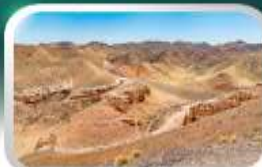
ชารินแกรนด์แคนยอน